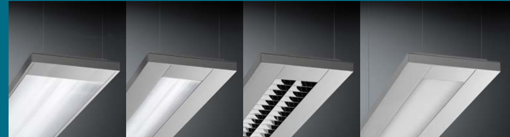
mit Mikroprismenabdeckung breit mit Micro Prismatic Cover wide

Für wechselnde Aufgaben, konsequent minimalistisch For changing tasks, consistently minimalist