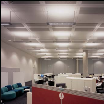
tätigkeits- und bedarfsorientierte Arbeitsplatzbeleuchtung

Activity and task-orientated workplace lighting